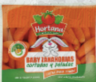
Baby Zanahorias Hortana Colación...