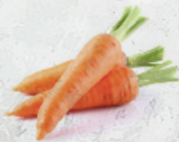
Zanahoria Amarilla al granel