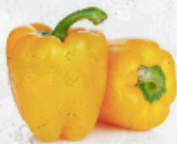
Pimiento Amarillo granel