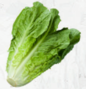
Lechuga Romana al granel