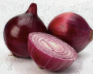
Cebolla Paiteña al granel