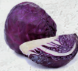
Col Morada al granel