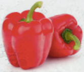
Pimiento Rojo al granel