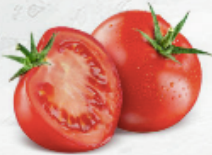
Tomate Riñon al granel