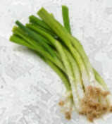
Cebolla Blanca Larga al Granel