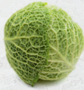
Col Rizada al granel