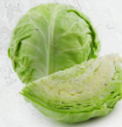
Col Blanca al granel